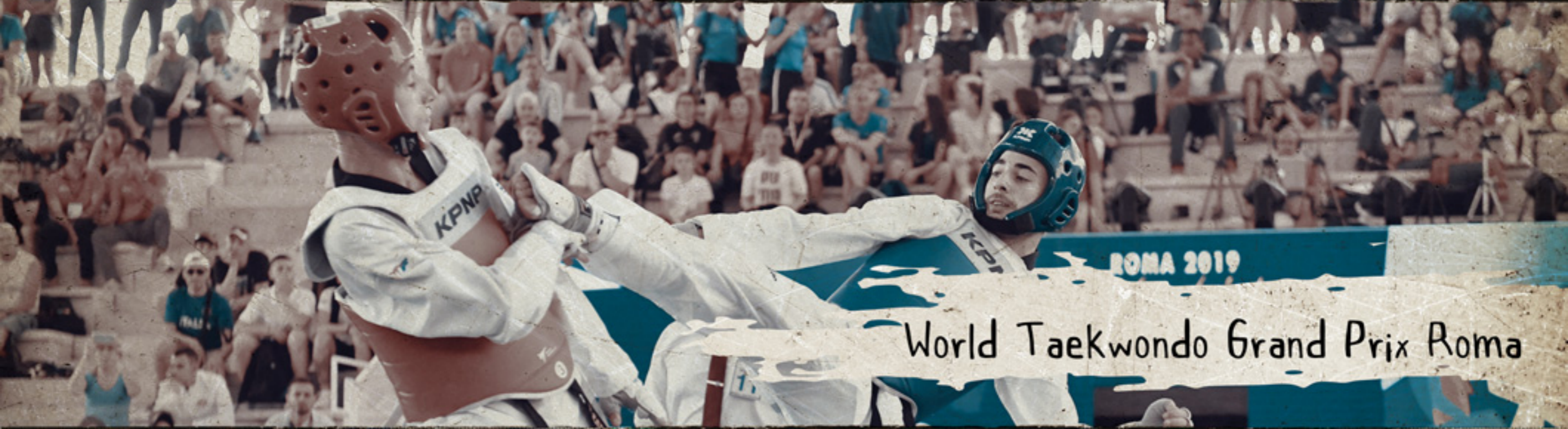
ROMA 2019 World Taekwondo Grand Prix Roma