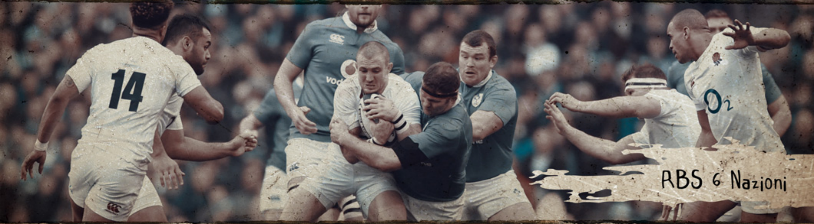
RBS 6 Nazioni