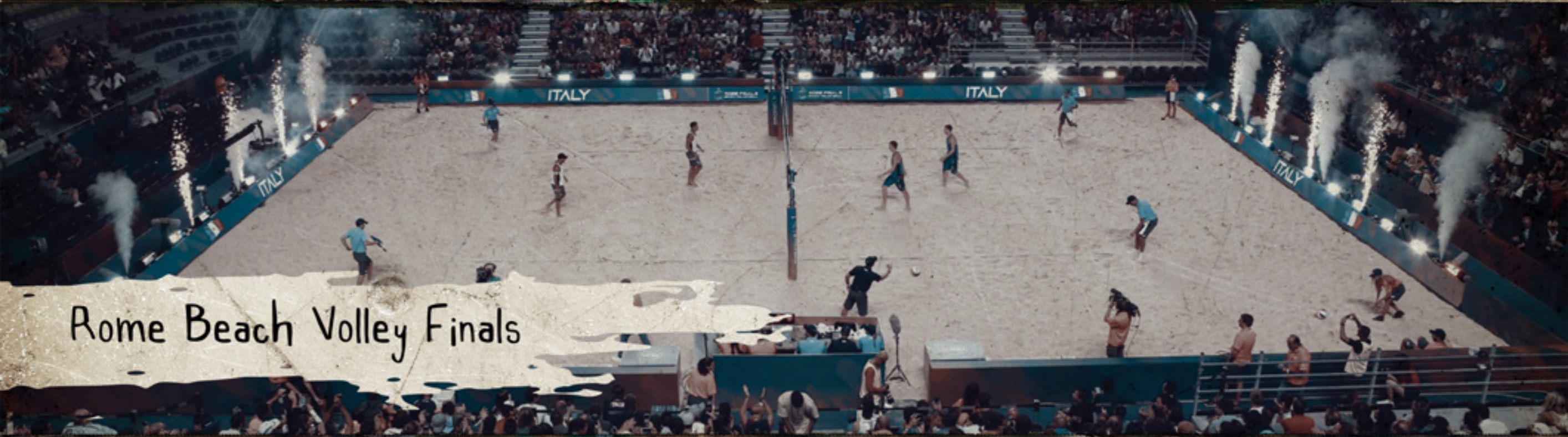
Rome Beach Volley Finals