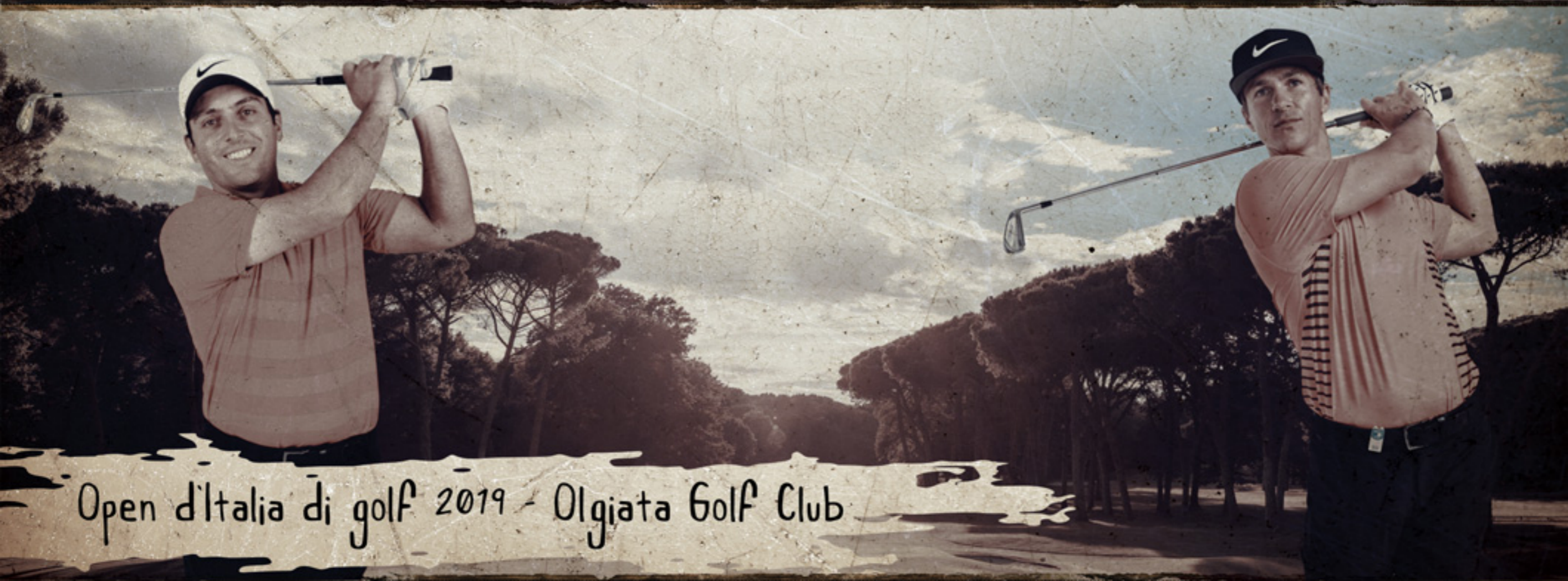
Open d'Italia di golf 2019 - Olgiata Golf Club