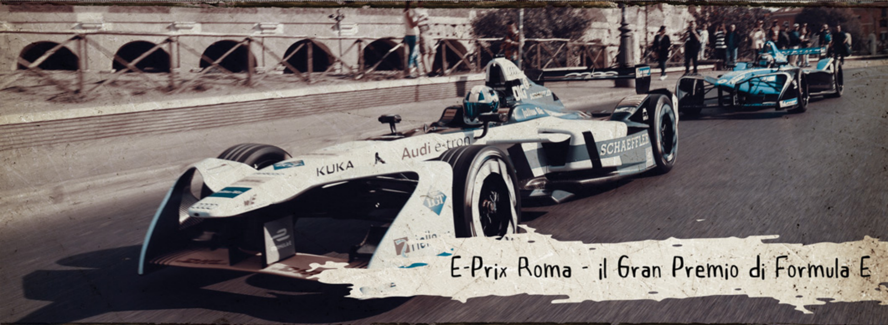
E-Prix Roma - il Gran Premio di Formula E