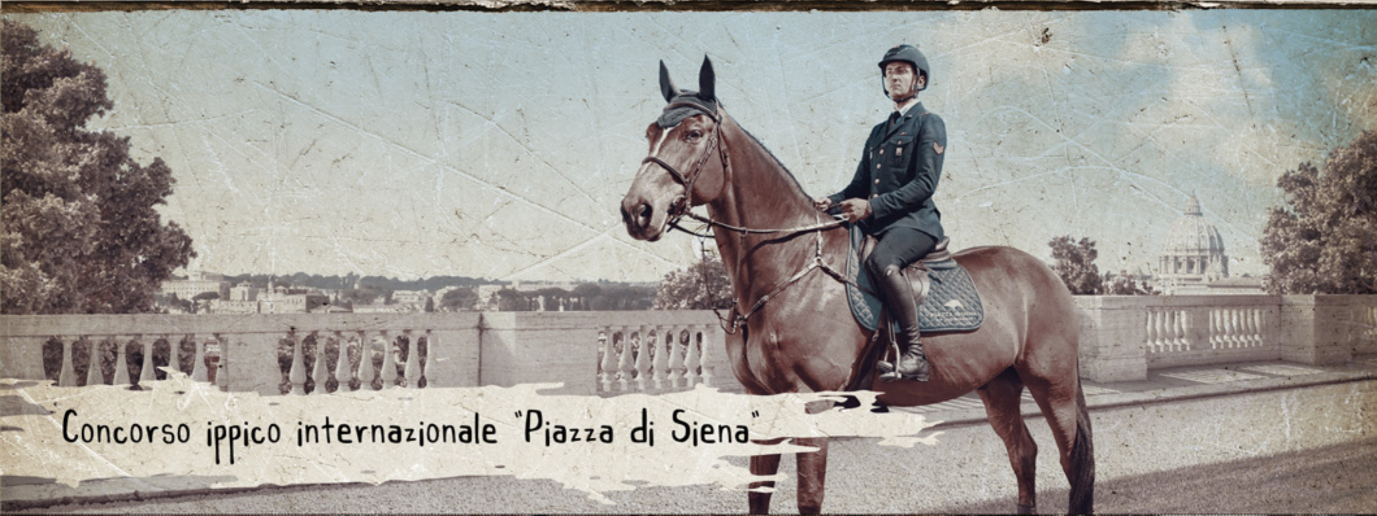
Concorso ippico internazionale "Piazza di Siena"

La passione per il nostro lavoro ci ha portato in questi ultimi anni a partecipare ad eventi di caratura internazionale, nelle magnifiche location che offre la Capitale: